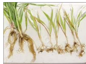
Angreb af "havreål". Rødderne er meget krogede og grenede. Til venstre ses to sunde planter.