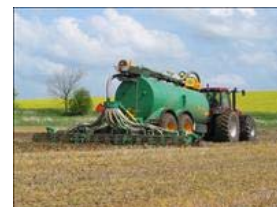
Havre kan med fordel fuldgødskes med gylle.

Havre kan med fordel fuldgødskes med gylle, hvis der kan opnås en ensartet fordeling af gyllen. Ved anvendelse af fast staldgødning eller dybstrøelse, bør der suppleres med 25-30 kg N i handelsgødning. Store mængder fast staldgødning vil endvidere øge risikoen for sen modning og eventuel genvækst i form af grøns kud.