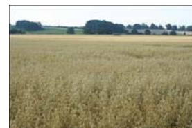
Havre har en god konkurrenceevne over for ukrudtet.

Målet med ukrudtsbekæmpelsen er at forhindre opformering af ukrudtsfrø og undgå ukrudt, der kan volde besvær ved høst.