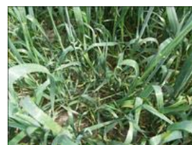
Dannelse af mange sideskud og lav vækst