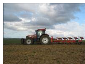
Det er normalt en fordel at pløje forud for såning af havre.