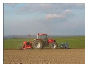
Havre sås, så snart jorden er tjenlig i foråret. Det er dog vigtigere at så godt end at så tidligt.