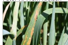
Havrepletbakteriose. Angreb kan forveksles med angreb af havrebladplet.